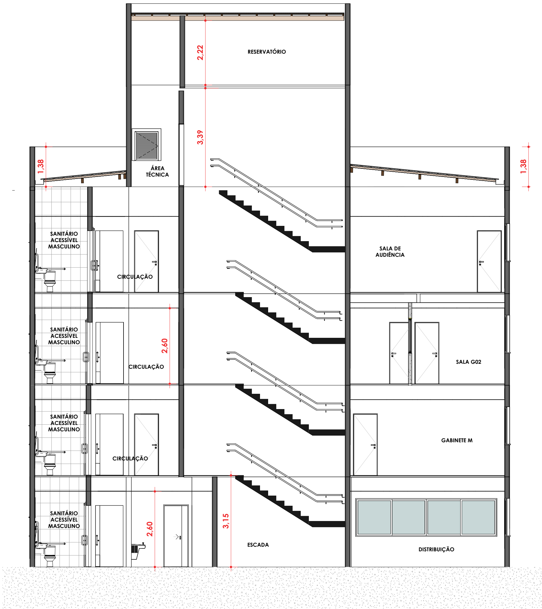
AA ESC:1 : 75