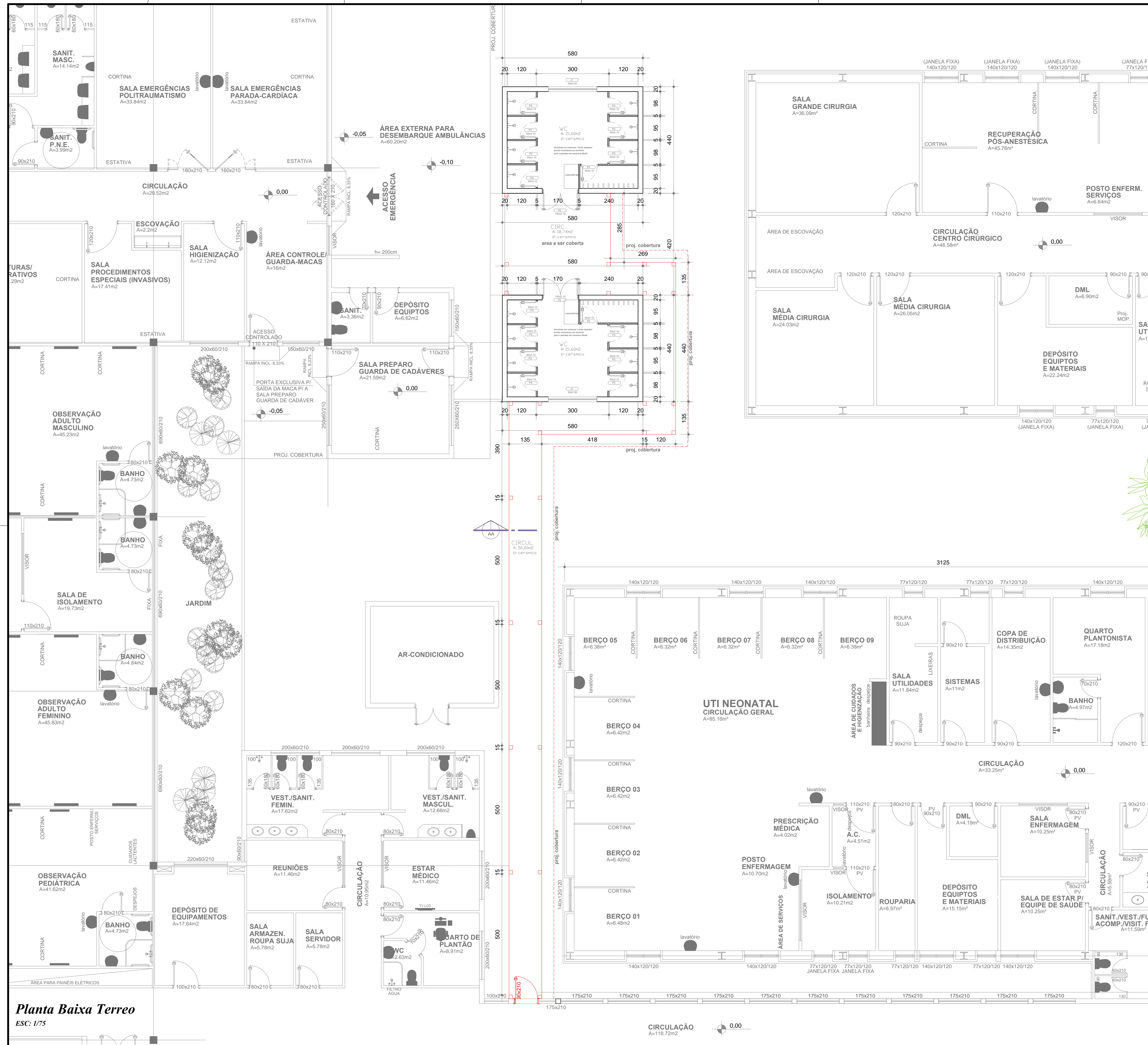
Planta Baixa Terreo ESC: 1/75