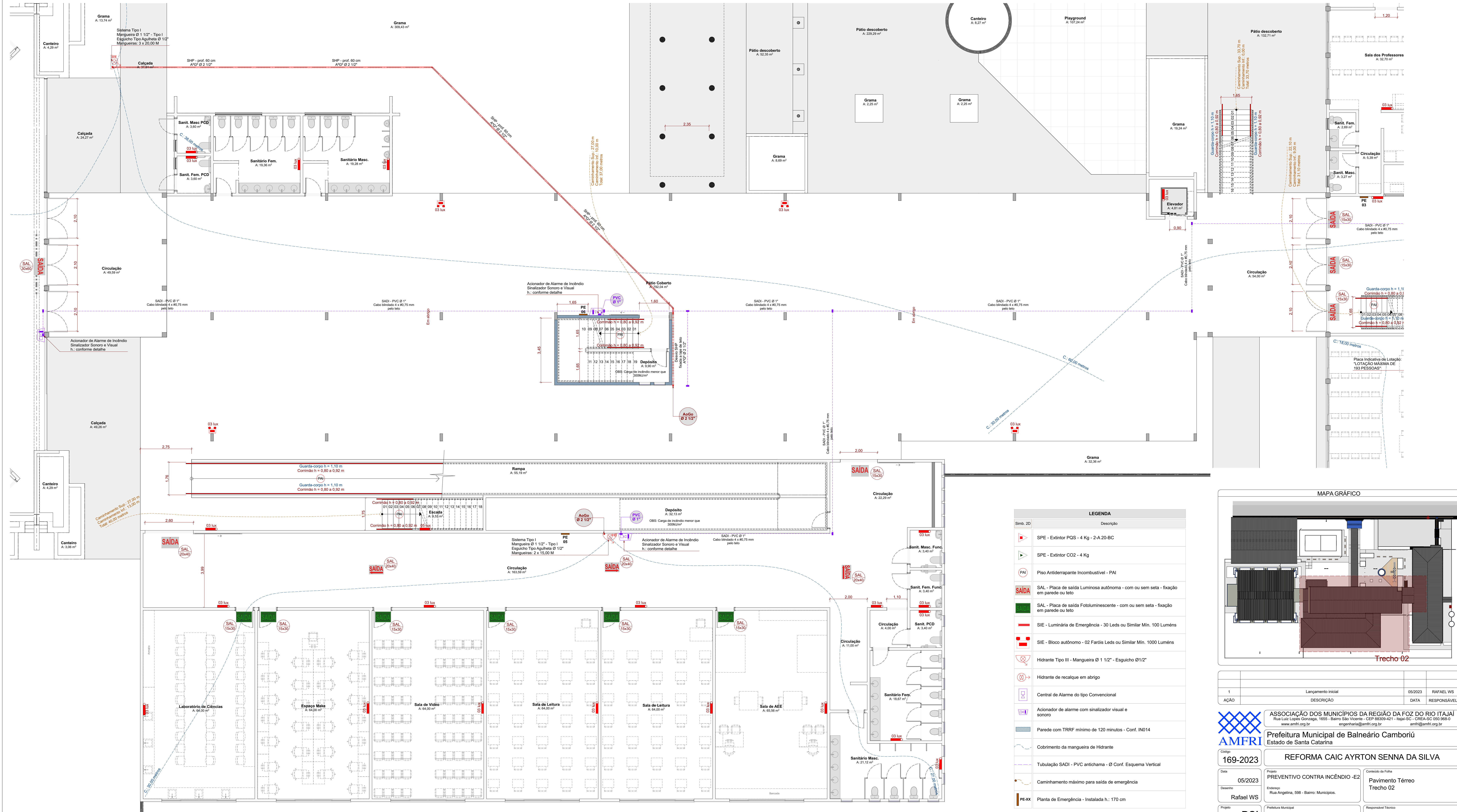
PAVIMENTO TÉRREO - TRECHO 02 Escala: 1:75