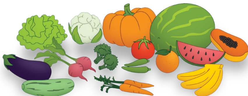
Quadro 2 – Grupos de alimentos