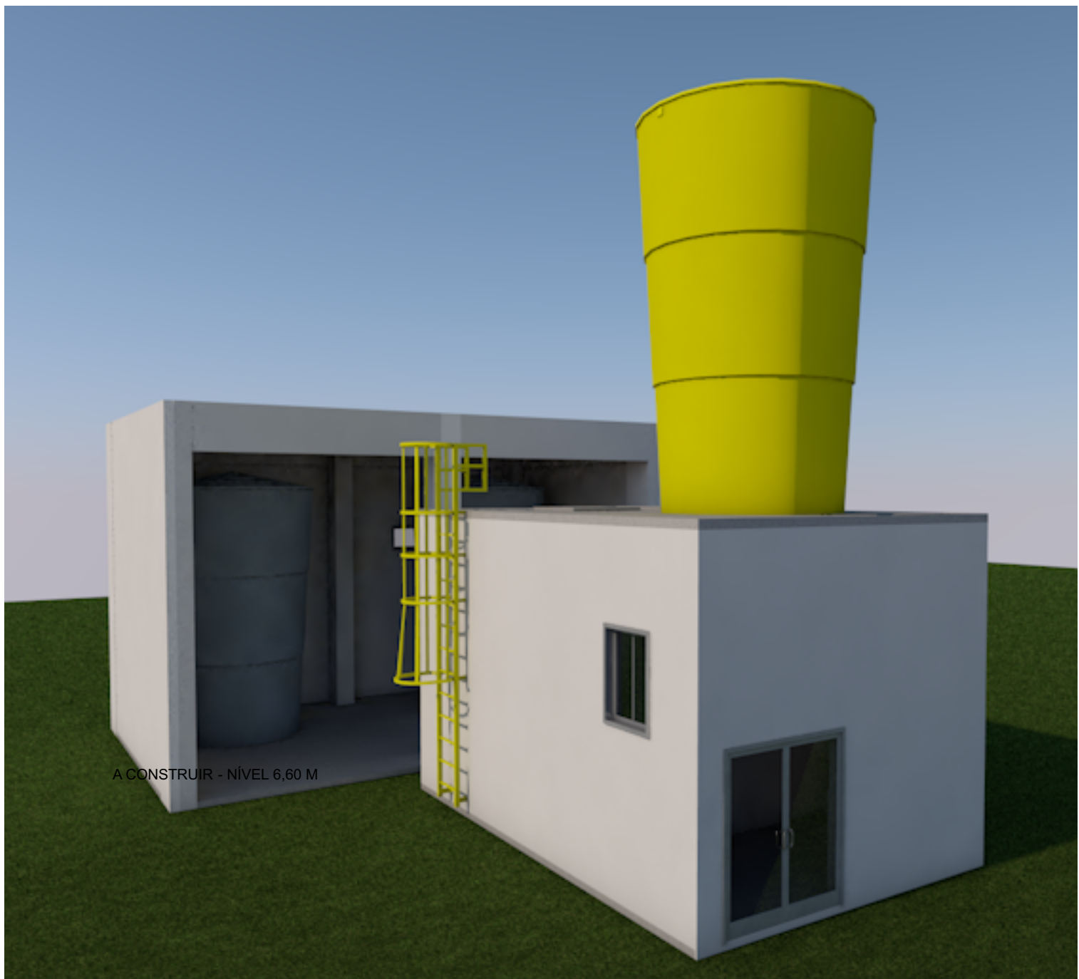
IMAGEM - DEMOLIÇÃO Escala: 1:1