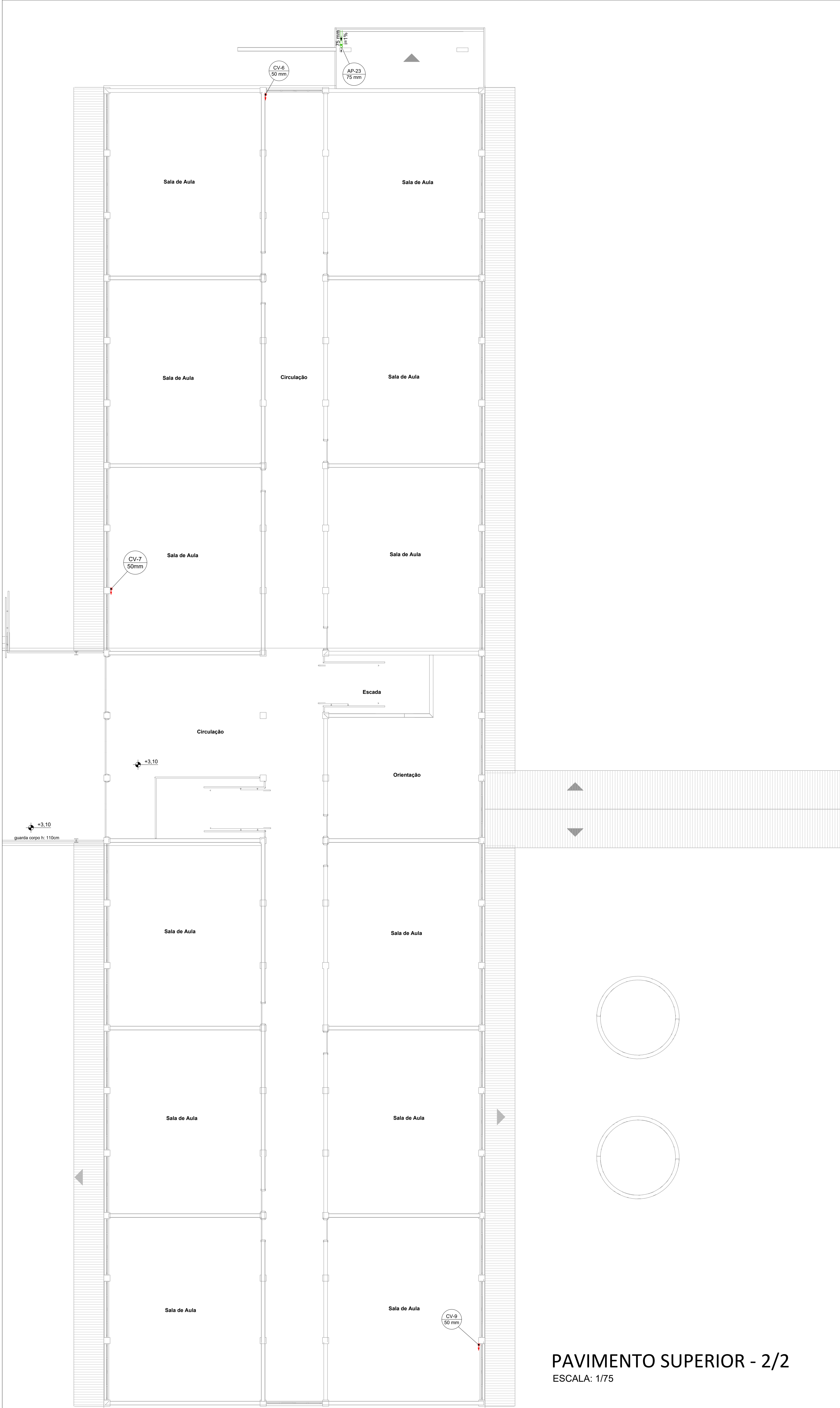
PAVIMENTO SUPERIOR - 2/2 ESCALA: 1/75