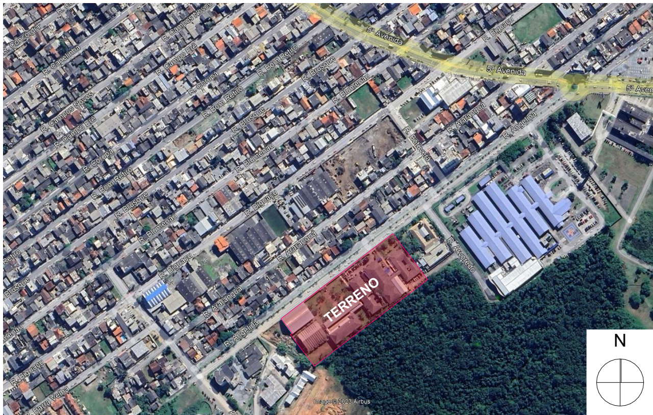
SITUAÇÃO Sem Escala