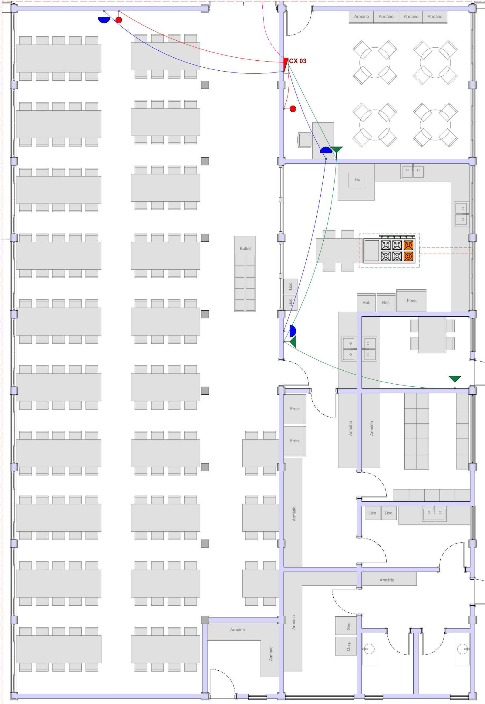
DETALHE 03 ESCALA 1:75