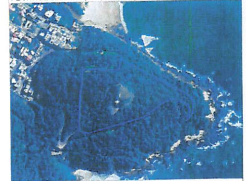
PLANTA DE LOCALIZAÇÃO (CADASTRO PMBC)