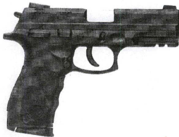
Figura 4: Retém de ferrolho ambidestra