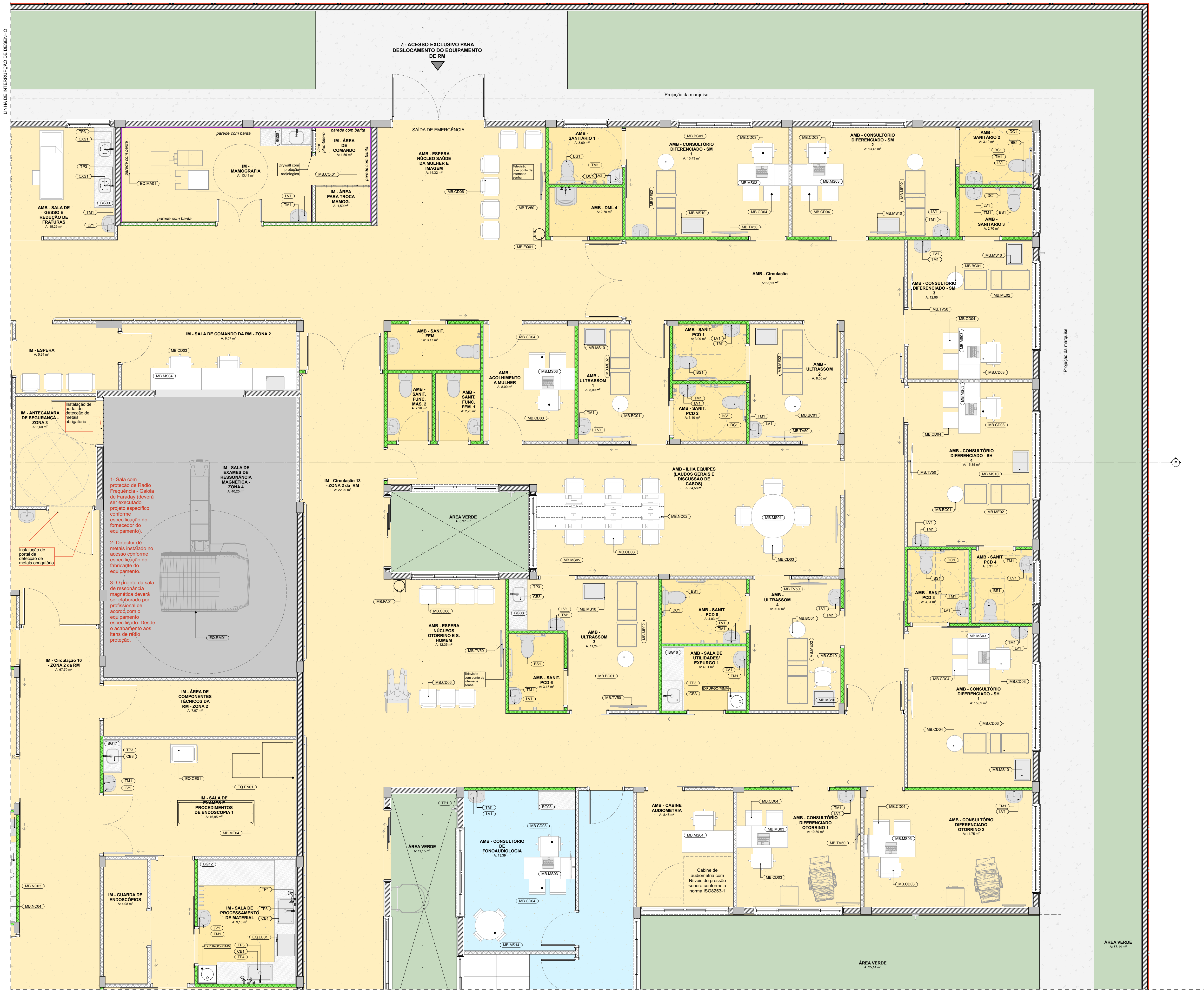
PLANTA DE LAYOUT TÉRREO Esc. = 1:50