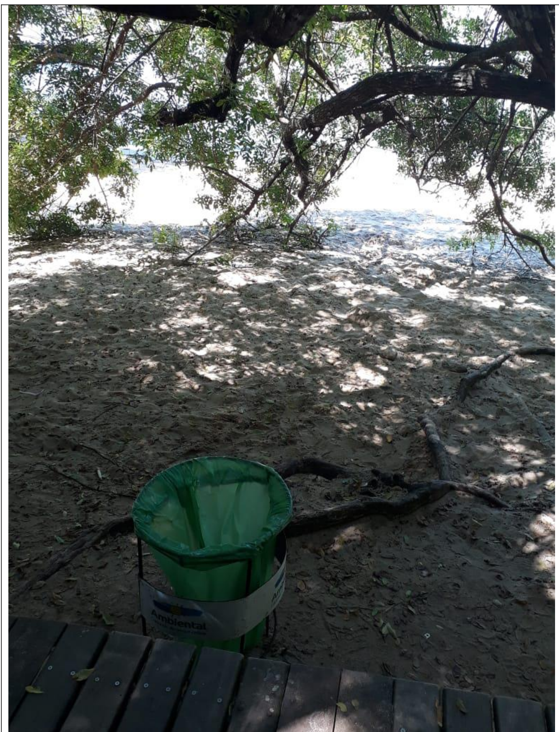
PRAIA DO COCO 18A