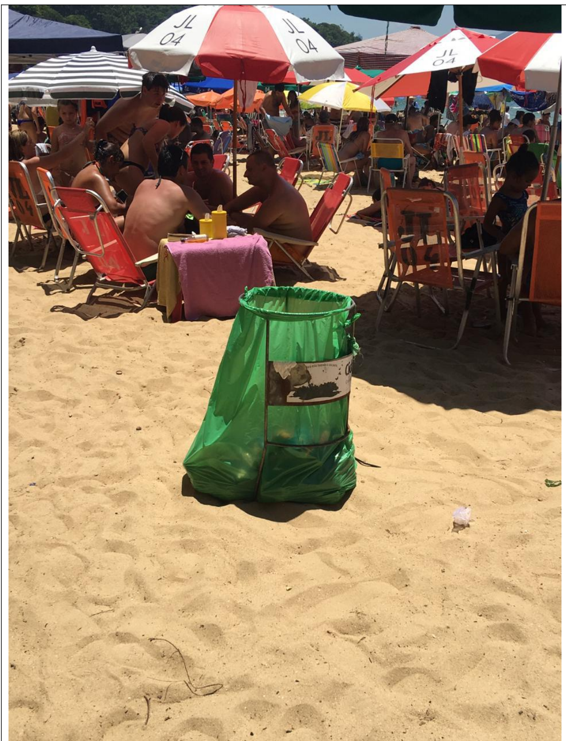
PRAIA DE LARANJEIRAS 18B