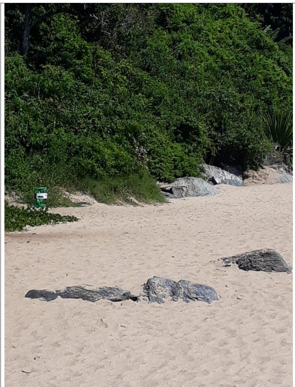
PRAIA DO BURACO 18B