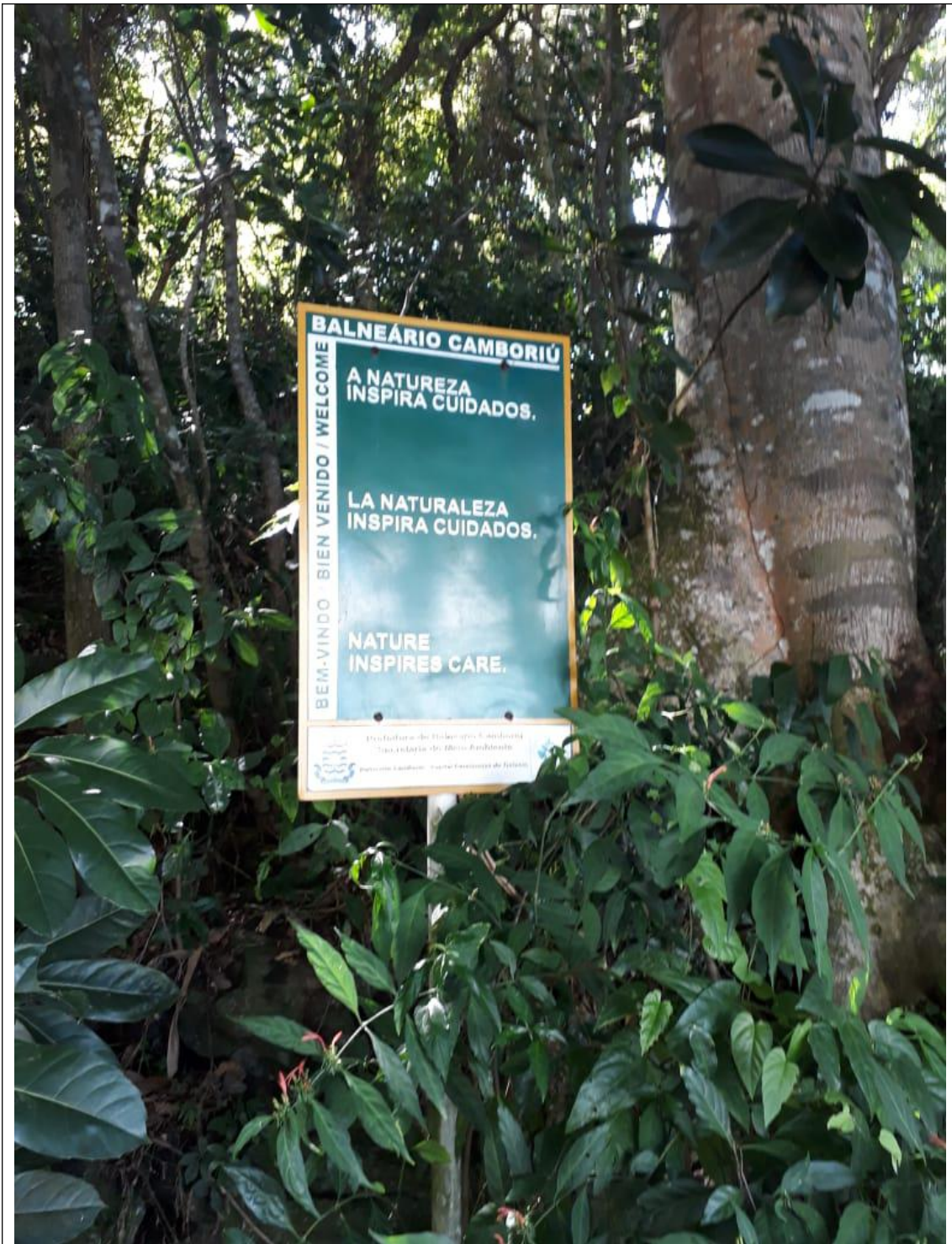
PRAIA DO COCO 05C