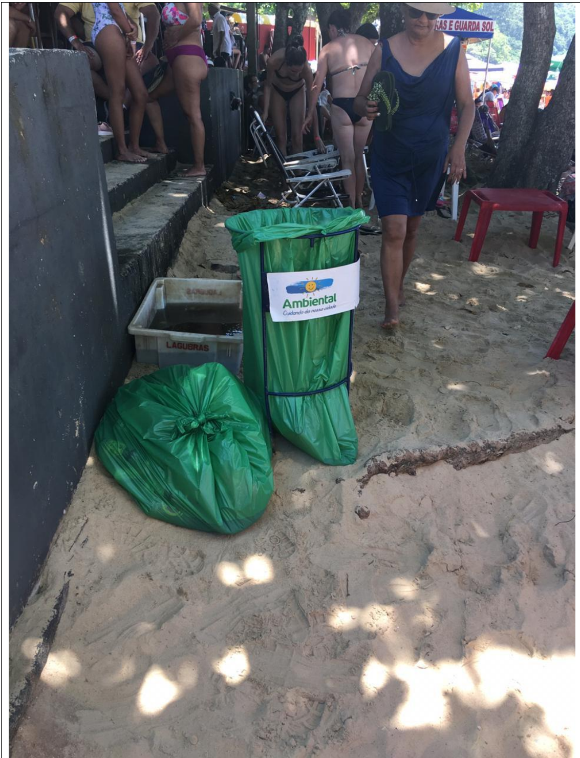
PRAIA DE LARANJEIRAS 18A