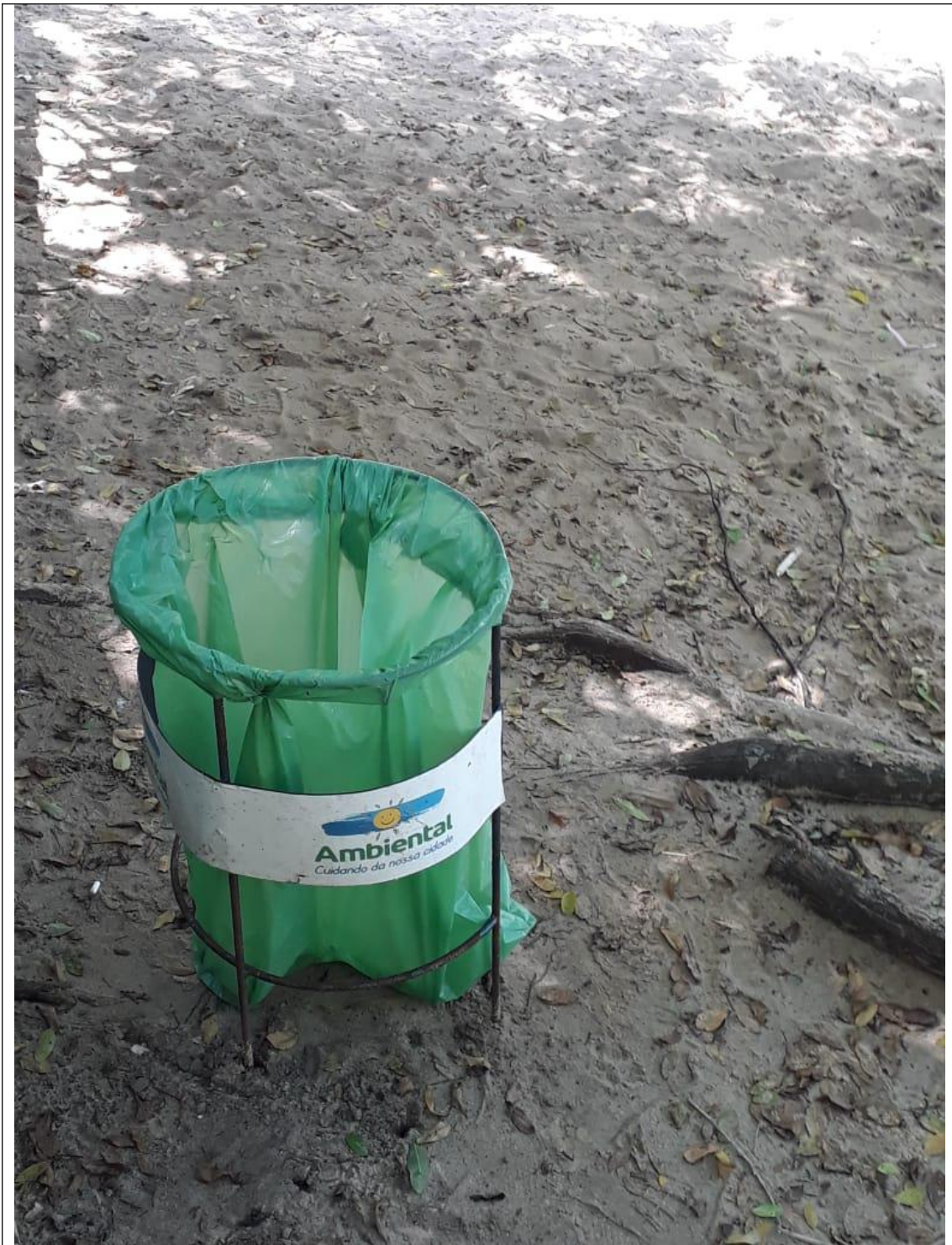
PRAIA DO COCO 18B