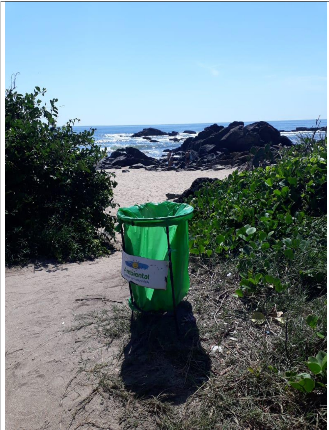
PRAIA DO BURACO 18A