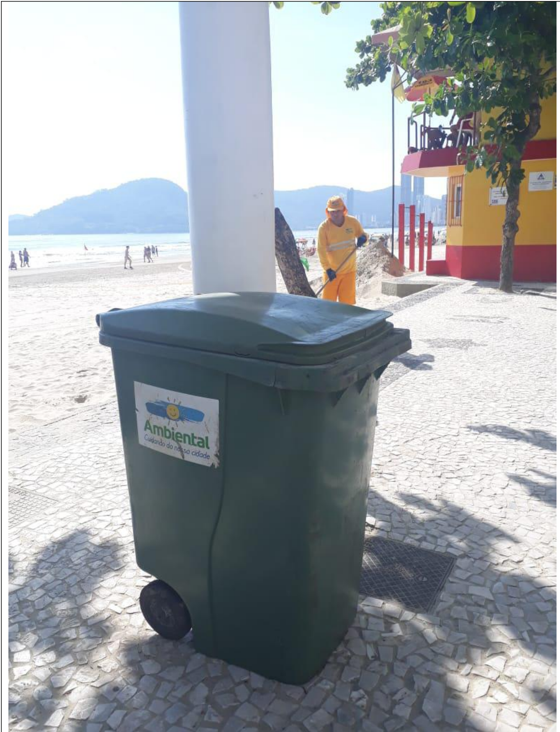
PRAIA CENTRAL 18A