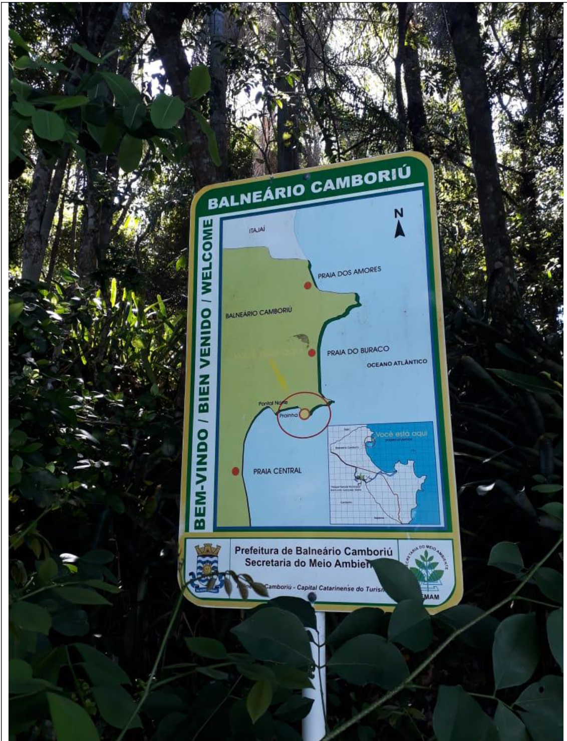
PRAIA DO COCO 05B