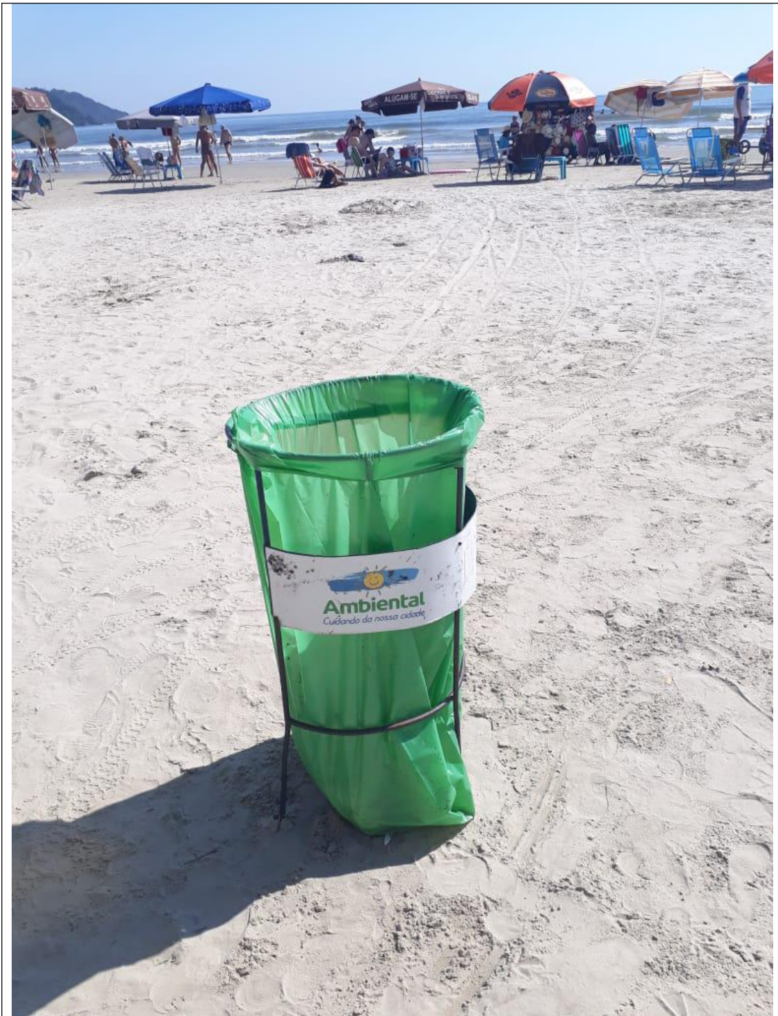
PRAIA CENTRAL 18B