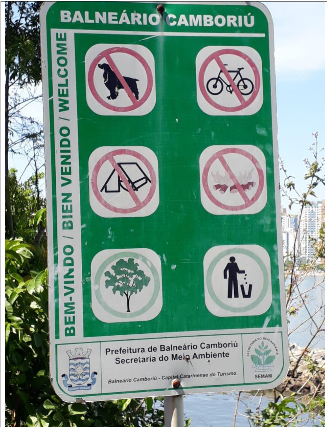
PRAIA DO COCO 05A