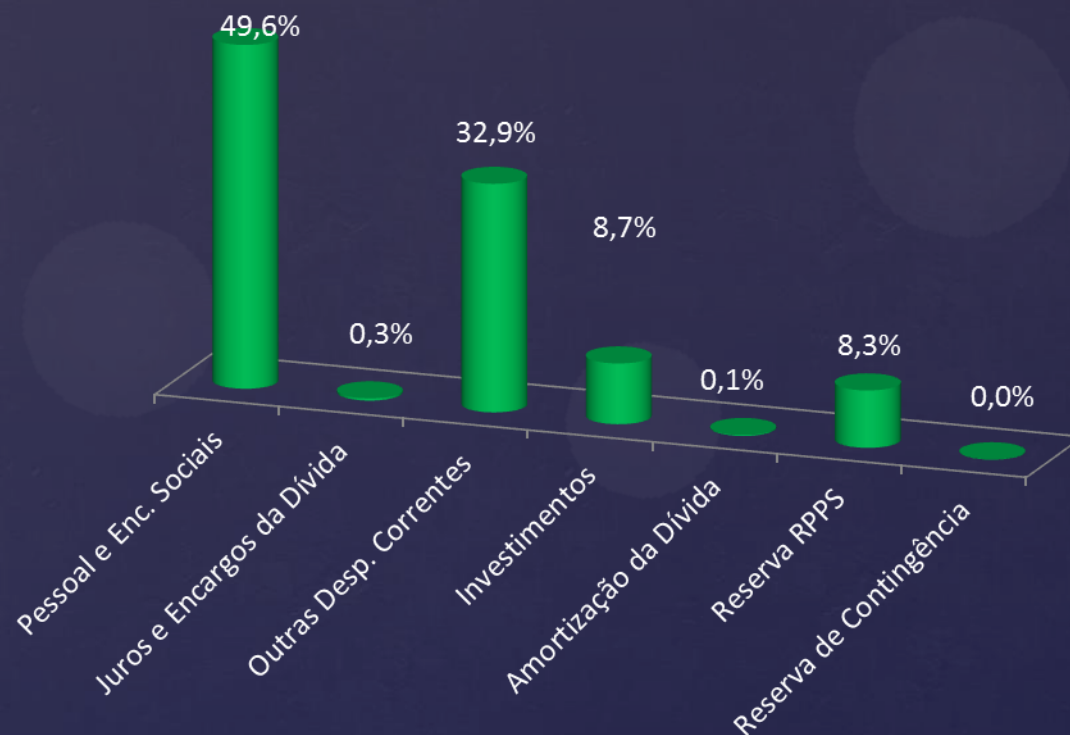
Gráfico das Despesas por modalidade de aplicação